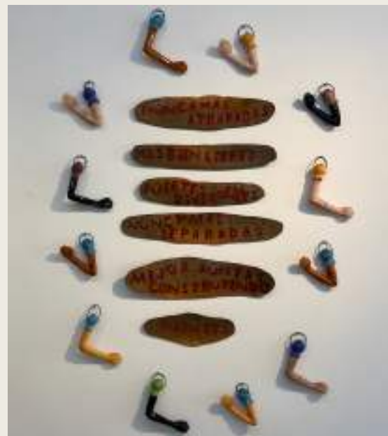
NICHO CANDELA - ANDREA ECHEVERRI