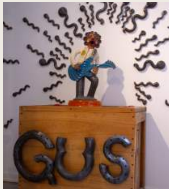
ETERNO - ATERCIOPELADOS